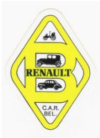
Oprichting van de CAR Bel.

Enthousiaste bezitters van een Renault 4CV hebben op 15 juni 1978 de Club van de 4CV van België opgericht. Andere eigenaars van oude Renault waren geïnteresseerd en voegden zich bij de Club. Hieruit is in 1980 de Club des Amateurs d'Anciennes Renault de Belgique (C.A.R. Bel.) ontstaan. Deze maakt deel uit van de organisatie C.A.R. die alle Clubs van oude Renault van Europa samenbrengt.