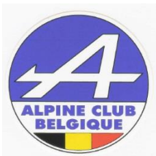
Oprichting van ACB.

Enthousiaste bezitters van een Renault 4CV hebben op 15 juni 1978 de Club van de 4CV van België opgericht. Andere eigenaars van oude Renault waren geïnteresseerd en voegden zich bij de Club. Hieruit is in 1980 de Club des Amateurs d'Anciennes Renault de Belgique (C.A.R. Bel.) ontstaan. Deze maakt deel uit van de organisatie C.A.R. die alle Clubs van oude Renault van Europa samenbrengt.